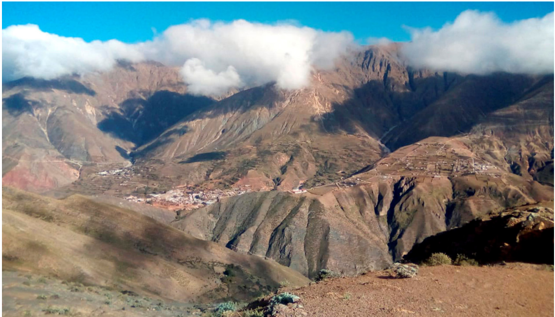
Figura 2. Paisaje de la localidad de Nazareno (Departamento Santa Victoria, Provincia de Salta, Argentina).

Martínez & Oakley, 2007; Martínez & Prado, 2013; Jarsún et al. , 2020). Esta información proviene de relevamientos, estudios e inventarios florísticos fundamentales para el conocimiento de la diversidad.