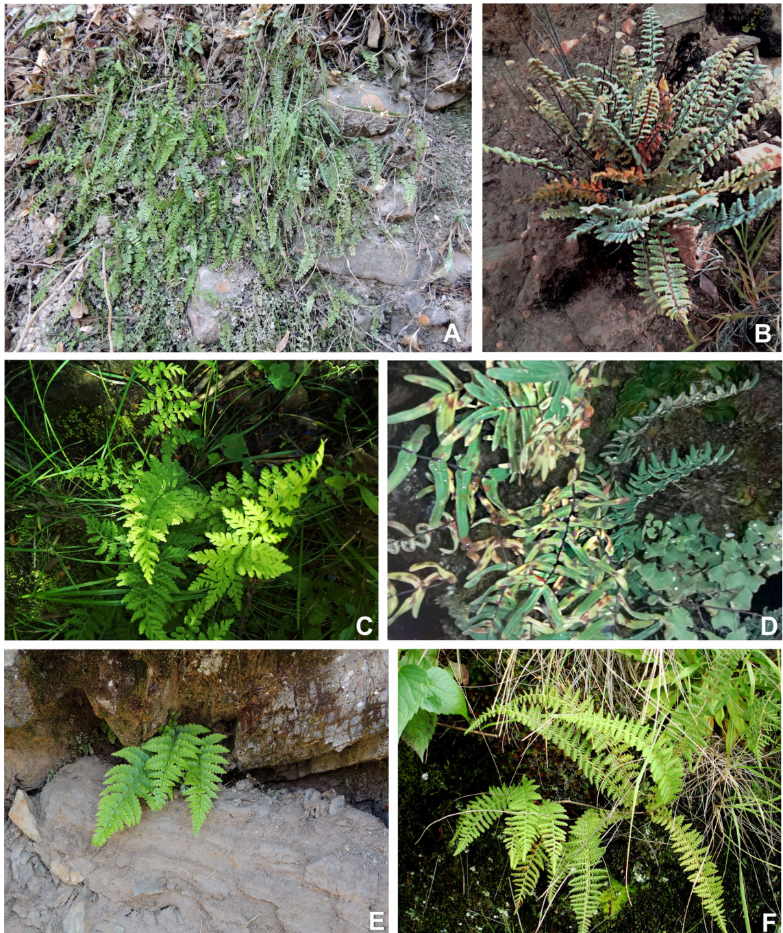
Figura 4. Helechos de Nazareno en su ambiente natural. A. Asplenium gilliesii . B. Cheilanthes buchtienii . C. Gagea marginata . D. Pellaea furcata . E. Polystichum lionelii . F. Woodsia montevidensis .